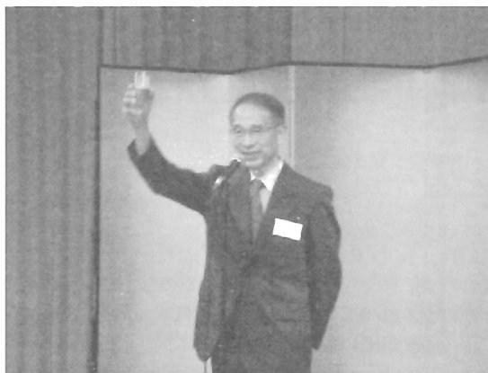
柘植研究運営審議会会長による乾杯(交流会)