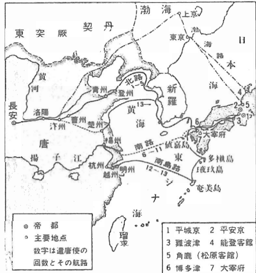
日本と唐の交通(8~9世紀ころ)