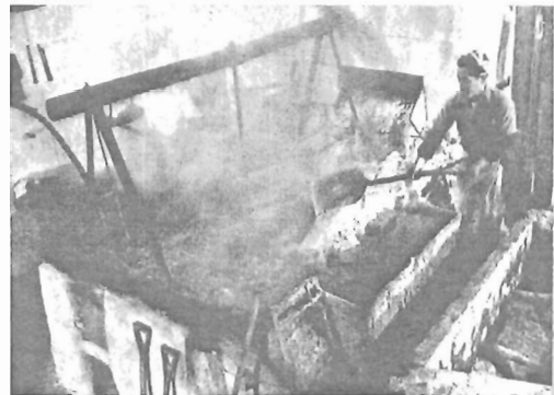
写真2 塩の中での焼立て風景(⑤) —『アサヒグラフ』より転載—